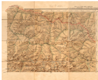
Mapa Pirineus centrals. 3/6. Fulla Val d'Aran. 1878-1890 Franz Schrader.

Recentment hem produït un film: el documental Aguestes Montanhes sobre la importància i l'efecte de l'arribada dels esquís a la Vall d'Aran fins a la fundació de l'estació d'esquí de Baqueira Beret. Un projecte molt complex, un homenatge a les persones forjadores de la història, un mosaic preciós. Us la recomano. Compreu-nos el DVD, encara estem pagant el projecte!