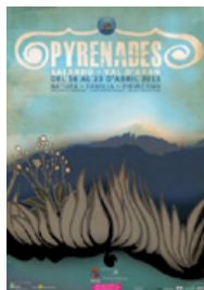
1 er Edició 2011

Els que ho han visitat ja coneixen la seva autenticitat i singularitat. I també el seu gran potencial per generar activitats amb els