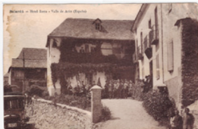
El rey Alfonso XIII a la porta del Refugi Rosta. 1924