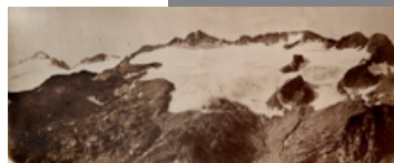
Glaciér: Maladretes i Pic Aneto. 1873