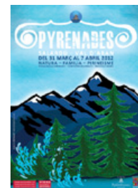
2 a Edició 2012