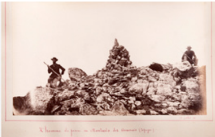
Pic de Montarto. 1873