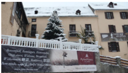
Refugi Rosta. 2010

Aquests i uns altres són capítols que han sofert un gran canvi els últims tres decennis i que han influït en aquesta evolució del turisme a la Vall d'Aran. Us en poso un exemple: fa trenta anys, l'agost de 1980, quan just havíem obert el Refugi Rosta amb la nostra actual direcció. Podia haver-hi una o dues habitacions ocupades. No teníem cap reserva però a les nits havíem de penjar el rètol de complet . El dia següent, es buidava al matí; però a la nit es tornava a omplir de la gent que circulava per la vall. Avui en dia, a l'agost, si no és per les reserves prèvies, es pot arribar a l'extrem de llogar una sola habitació per setmana amb viatgers passants .