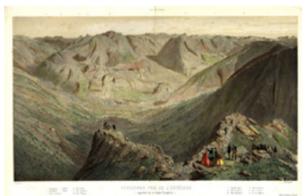
1 er Edició 2011